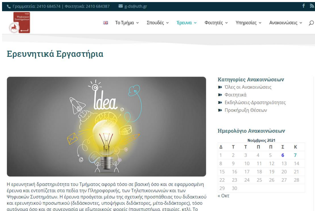
Εικόνα 4: Το screenshot της προηγούμενης εικόνας, σωστά αυτή τη φορά.

Επιπλέον θα πρέπει τα κείμενα στην εικόνα να είναι αναγνώσιμα και η εικόνα καθαρή όπως στο παράδειγμα στην Εικόνα 4. Αποθηκεύστε screenshots εφαρμογών σε PNG.