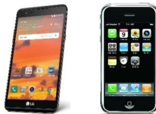
Εικόνα 2: Κινητά τηλέφωνα.

Η χρήση των εντολών του Word για την κατασκευή παραπομπών και λεζάντων, είναι υποχρεωτική! Έτσι απαλλάσσετε από το ζήτημα της αρίθμησης αυτών των στοιχείων και των μεταβολών που αυτά χρειάζονται, όταν γίνονται μεγάλες μεταβολές στο κείμενο (γίνονται όλα αυτόματα).